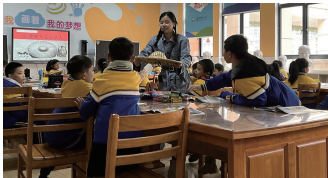
图5 “我编斗笠送亲人”课堂现场

有更深的情感, 充分发挥学生的主体作用。其次, 教师可以展示一些描绘红军生活的照片和当时年代亲手编织的斗笠, 看一看, 摸一摸, 供学生深入观察。帮助他们理解红军长征的艰苦生活。再次, 让学生开展讨论活动, 谈谈自己应该为红军做点什么, 在讨论的过程中, 不仅可以加深学生的情感体验, 更大程度上激发学生对美术创作的兴趣和热情, 学生在教师的指导下, 发挥自己的思维进行大胆创作, 使其能够积极投入“我编斗笠送亲人”的项目中。