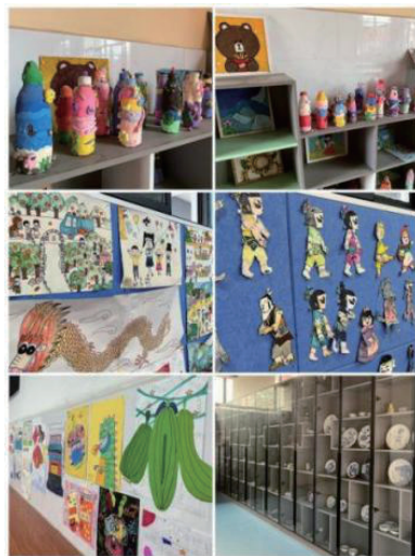
图1 墙面作品展示

(1) 合理利用空间:教师可以利用教室的墙壁、角落等空间,布置一些优秀的美术作品(图1、图2),如学生作品、大师作品等,以激发学生的艺术兴趣。