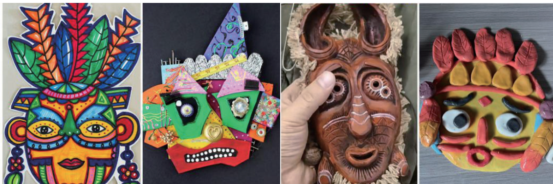
图7 “面具”课堂作品

以赣美版四年级下册《面具》这一课为例(图7), 在教授面具制作时, 教师可以要求学生创作一件具有创意的手工作品, 鼓励学生运用不同的媒介, 在不同的艺术形式中根据自身想法设计作品。教师可以指导学生以绘画的方式设计有个性的面具, 使用拼贴的方式结合传统绘画进行融合创作, 尝试将这些手工艺的纹理、质感融入其中, 让作品更加富有立体效果。