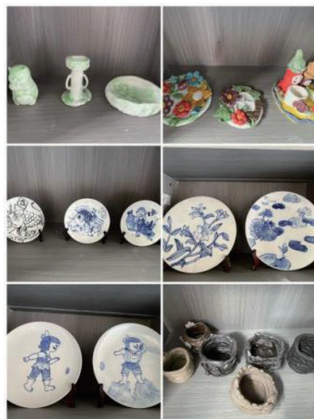
图2 其他展示

(2) 选择适宜色彩:色彩对人的情绪和心理有着重要影响,学校可以通过选择适宜的色彩来营造课堂氛围(图3、图4)。例如,使用温暖的色调可以营造轻松愉快的氛围,使用冷色调则可以营造安静专注的氛围。