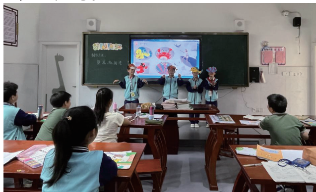
图6 “鄱湖渔歌”课堂现场

以赣美版小学美术教材三年级上册《鄱湖渔歌》的教学为例(图6), 为更好地激发学生的学习兴趣, 教师可以设计“鱼家族”成员造型的游戏。首先, 在游戏开始前, 教师可以拿出提前准备好的各式各样的鱼家族头套, 然后要求学生用肢体语言来演一演自己头套上的鱼类造型, 让学生在互动中体验“鱼家族”的形状特点。其次各组学生可以展示自己的作品, 为了让游戏可以更加生动有趣, 教师可以为设立几个特色趣味性奖项: 鄱湖探险家奖、珍珠宝藏奖、奇鱼妙想奖、生态和谐奖等。这样的教学活动不仅能够构建有趣的课堂氛围, 还能让学生在游戏中的感受到自己在艺术创作中获得的成就感。