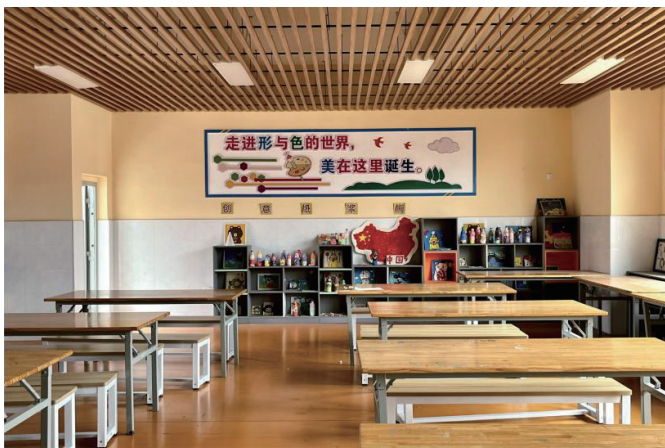
图4 美术教室2