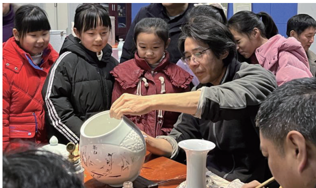
图8 陶艺名师现场讲解

教师应充分利用现有的教学资源, 在时间和资源上保障学生都有达成学习成果的机会。在学校教学资源方面, 可以积极开发新的教学资源, 如组织校外写生、邀请艺术家讲座、现场教学(图8)等, 以丰富教学内容和形式。