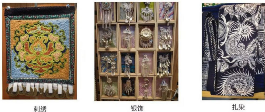
图二刺绣、银饰、扎染文创产品

因此应当深入挖掘侗锦文化内涵,精准提炼其独特的精神内核与艺术价值。将传统元素与现代设计理念巧妙结合,推出更多风格独特、创意十足的文创产品,让这一承载着千年民族智慧与情感的文化瑰宝,在新时代的浪潮中焕发出全新的生机与活力,绽放出更加绚烂夺目的光彩。