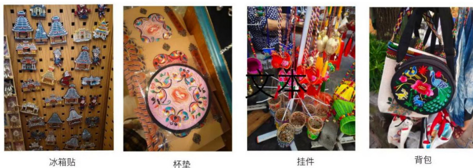
图1市面上文创样式

陷入同质化沼泽之中,发展之路举步维艰。放眼望去,侗族文创产品看似琳琅满目,实则千篇一律。由于缺乏创新,大多产品只是一味将侗族特色的风景、建筑、纹样转印在常见的产品上,如下图所示的冰箱贴、杯垫、小挂件等。目前市面上的文创产品缺少对侗族文化内涵的挖掘与创意转化,难以将传统文化与当代审美与设计理念相结合,难以准确向外界展现侗族独特的文化与内涵,使得侗族文创在竞争激烈的市场中逐渐失去吸引力。